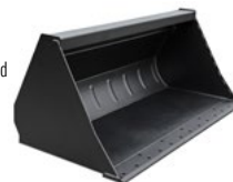
Erdschaufel rund Rad- und Teleradlader