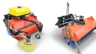
Mit Schmutzfangbehälter, Wasserbehälter mit Düsenprüheinrichtung und Seitenbesen