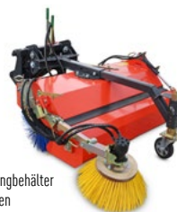
Mit Schmutzfangbehälter und Seitenbesen

Kehrmaschine mit Schmutzfangbehälter und hydraulischer Entleerung oder ohne Behälter erhältlich. Auf Wunsch auch mit Schnee-Kehrwalze (auch für Laub geeignet), Wasserbehälter mit Düsenprüheinrichtung und Seitenbesen, hydraulische Seiteneinstellung (inkl. Selektionsventil). Verschiedene Bürstendurchmesser möglich: 520 mm / 600 mm / 700 mm