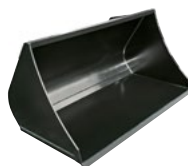
Erdschaufel rund für Kompaktlader

Stabile Erdschaufel für schwere Lasten und Erdarbeiten. Optional mit Reißzähnen und Wendemesser lieferbar.