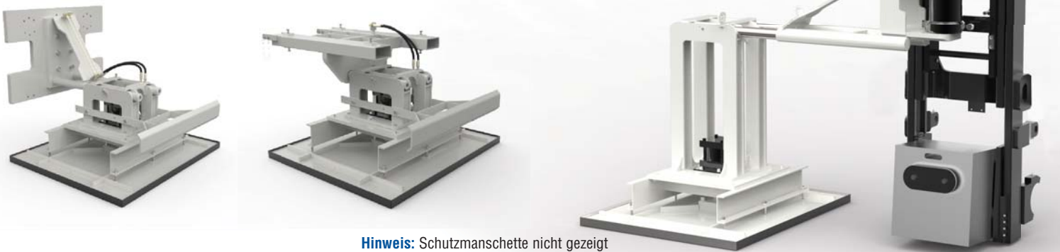
Hinweis: Schutzmanschette nicht gezeigt

Mit dem magnetischen Lagengreifer von Cascade wird eine komplette Lage mit Dosen von einem mehrlagigen Konservendosenstapel entnommen. Diese komplette Lage kann anschließend auf eine neue Palette übertragen werden, um diese dann aus mehreren Lagen mit verschiedenen Produkten zusammenzustellen. Das Konservenprodukt kann in der Form variieren und verschiedene Produkte umfassen. In einigen Fällen können auch zwei mit Folie umwickelte Lagen Konservendosen transportiert werden. Der Lagengreifer bietet beispielsweise auch für Gläser oder Kunststoffeimer mit Metaldeckeln großes Potential.