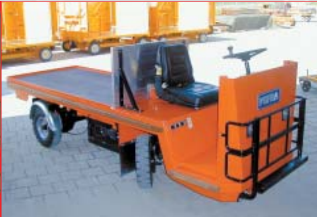
Plattformwagen Typ 610 platform vehicle model 610

Humans are in need of icons and tales. One of the icons of the 21st century is undoubtedly the mobile phone, further mobility and creativity. The PEFRA plc has devoted their efforts to the latter and this has become one of the mainstays of their business activities. The company focuses on the aims of their customers and safeguards their interests.