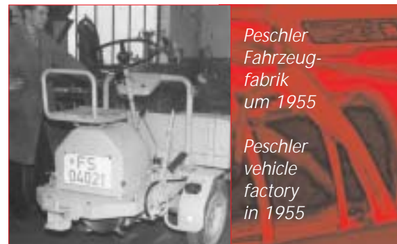
Peschler Fahrzeugfabrik um 1955

With determination, confidence and clear-cut decisions PEFRA PLC are well-positioned to cope with these challenges and win the future.