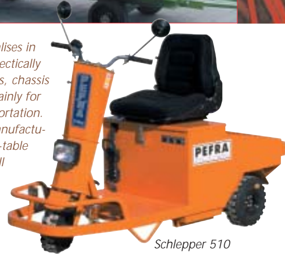
Schlepper 510 tow tractor 510

In addition, PEFRA PLC offers a wide variety of proprietary trailers. Trailers can be designed and tailored to the individual needs of the customer. Electrically powered vehicles are available as pick-up (or platform) tractors, either in 3- or 4-wheel options. As previously mentioned, tractors can be built with various options to meet the special requirements of the customer.